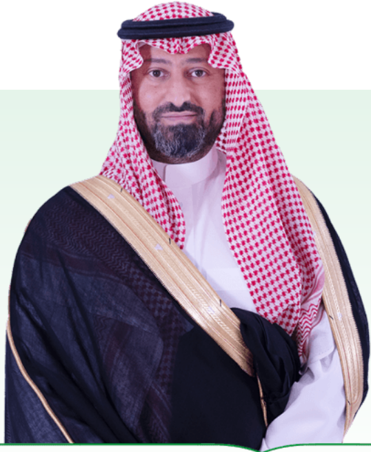
نايف بن سلطان بن محمد بن سعود الكبير رئيس مجلس الإدارة

يسعدني أن أشارككم تقرير الاستدامة الخاص بشركة المراعي لعام 2023، فقد حققنا هذا العام تقدمًا ملحوظًا في مبادرات الاستدامة الخاصة بنا، وحرصنا على مواصلة جهودنا مع الأهداف والالتزامات التي حددتها إستراتيجية “أداءً أفضل كلَّ يومٍ”.